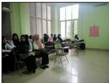
Gambar 2. Presentasi dilakukan untuk memberi bimbingan materi pada Mahasiswa

Kegiatan ini memberikan siswa pengetahuan yang mereka butuhkan untuk menjadi penulis ilmiah yang kompeten dan efisien, dan ini menunjukkan pendekatan paling sederhana dan paling efektif untuk menulis dengan baik dan akurat, serta bagaimana menyusun proposal penelitian untuk siswa studi pendidikan guru sekolah dasar program, fakultas keguruan dan pendidikan di Universitas Muhammadiyah Buton. Kegiatan bimbingan menulis artikel ilmiah mahasiswa bertujuan untuk meningkatkan semangat mahasiswa dalam menulis karya ilmiah. Hal ini dilakukan karena siswa memiliki pemahaman dan pengetahuan menulis yang kurang, sehingga menyulitkan mereka untuk membuat karya tulis ilmiah khususnya makalah. Pertumbuhan kemampuan menghasilkan makalah merupakan salah satu jenis pengembangan mahasiswa. Kapasitas ini mudah terlihat dalam penulisan yang terorganisir.