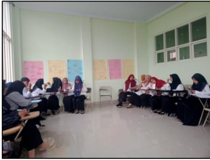
Gambar 4. Pertemuan kedua dalam menjelaskan materi Paraphrase

Proses kegiatan dalam menghasilkan makalah yang tidak memplagiasi karya orang lain melalui uraian di bawah ini: