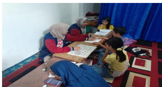
Gambar 1. Kegiatan Mendampingi belajar

Senin sampai dengan Jumat dengan jadwal pendampingan yaitu pukul 09.00 – 12.00 untuk siswa SD, dan pukul 18.00 – 19.30 untuk siswa SMP dan SMA. Setiap pendampingan belajar secara luring, siswa diwajibkan memakai masker, mencuci tangan sebelum dan setelah masuk ruang pendampingan belajar, serta melakukan physical distancing. Program pendampingan belajar untuk anak sekolah ini yaitu, Kegiatan membantu siswa dalam menyelesaikan tugas sekolah mereka dan menjelaskan kepada para siswa tentang materi pelajaran siswa yang kurang di fahami.