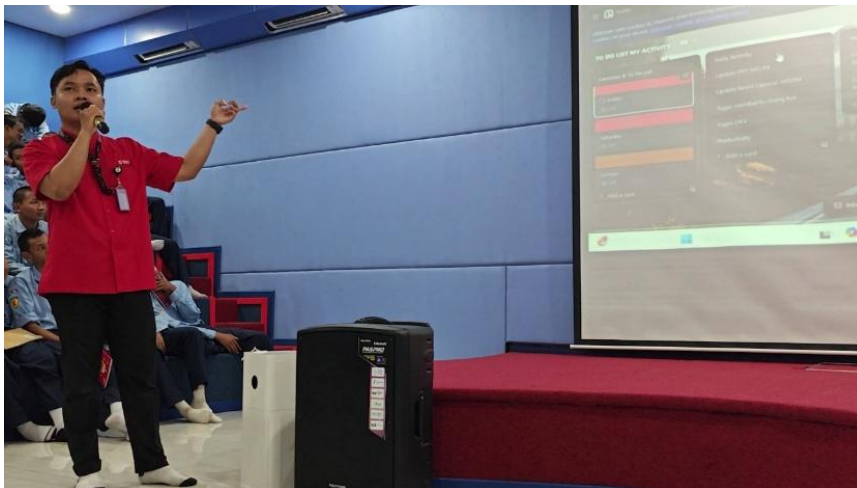
Gambar 3 Pemberian Materi terkait Implementasi Trello