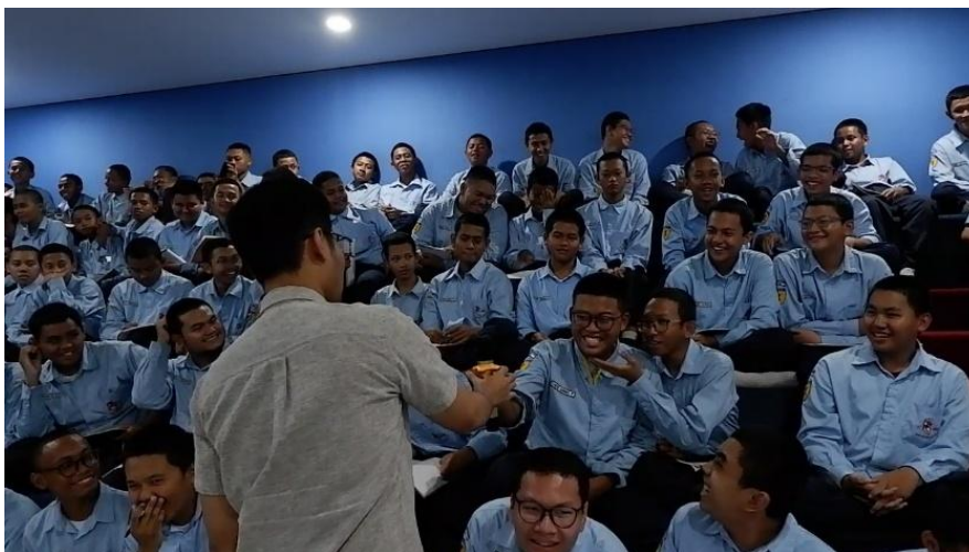
Gambar 4 Kegiatan Diskusi dan Tanya Jawab

Pada materi pertama diberikan materi terkait dengan mengenali potensi diri siswa. Dalam materi ini dijelaskan mengenai mengapa mengenali potensi diri masing-masing itu menjadi penting. Mengenali