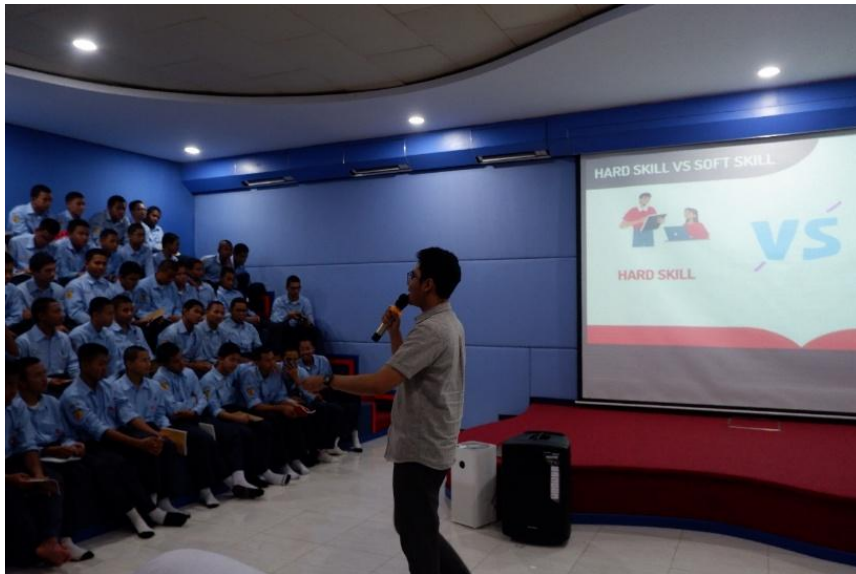
Gambar 2 Kegiatan Pemberian Materi terkait Mengenali Potensi Diri