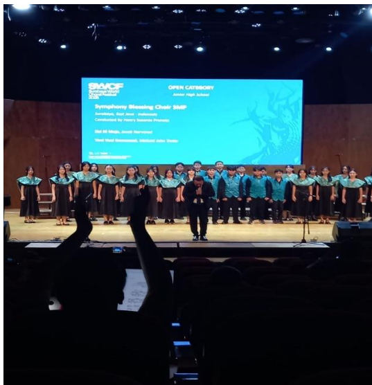
Gambar 8 Foto pada saat dipanggung pertandingan