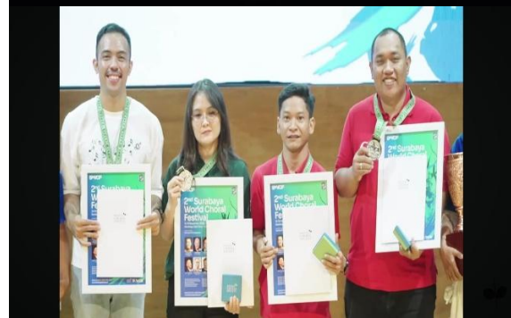
Gambar 10. Menerima sertifikat Juara