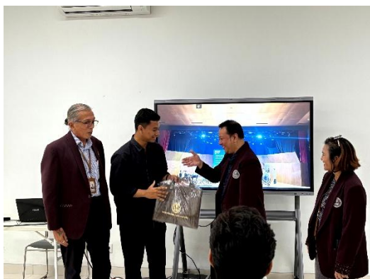
Gambar 5. Pemberian cendera mata dari UC kepada guru pembina.

Puncak dari rangkaian program ini adalah keberhasilan paduan suara SCB–SCK meraih kemenangan pada kompetisi yang diselenggarakan di Balai Pemuda Surabaya. Kemenangan ini tidak hanya mencerminkan peningkatan kemampuan teknis siswa, tetapi juga menunjukkan keberhasilan metode pelatihan berbasis kolaborasi, karakter, dan motivasi yang diterapkan melalui PKM. Prestasi ini menjadi bukti bahwa intervensi perguruan tinggi mampu memberikan dampak nyata pada kualitas pengembangan seni di sekolah.