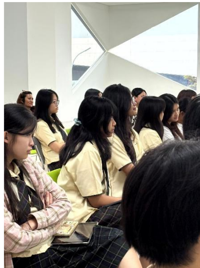
Gambar 3. Foto saat mendengarkan pemaparan edukasi / pembelajaran, jaringan, kemitraan.

Evaluasi dilakukan melalui observasi terstruktur, refleksi peserta, serta penilaian performa sebelum dan sesudah intervensi menggunakan rubrik sederhana.