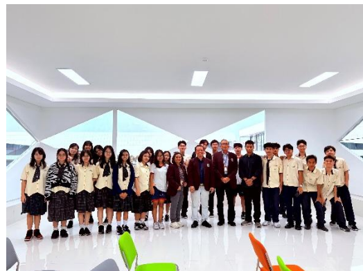
Gambar 4. Foto bersama setelah edukasi / pembelajaran, jaringan, kemitraan.