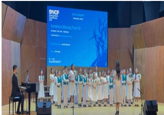
Gambar 7 Foto pada saat dipanggung pertandingan

dan kondisi psikologis siswa juga memengaruhi hasil. Keberlanjutan program direncanakan melalui pelatihan lanjutan bagi guru pembina, penyusunan kalender latihan pascaprogram, serta perluasan kolaborasi dengan sekolah lain yang memiliki komunitas paduan suara.