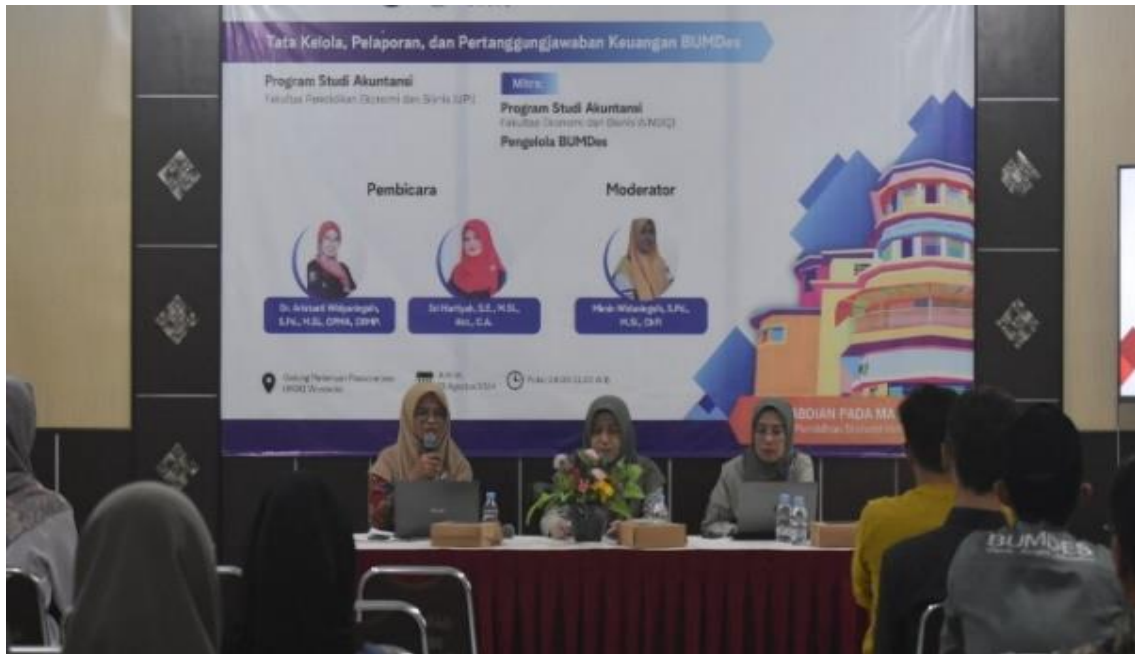
Gambar 8. Dokumentasi Kegiatan Pengabdian