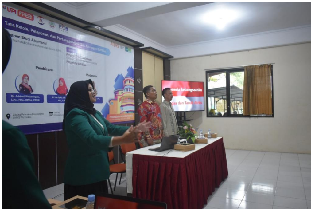
Gambar 9. Dokumentasi Kegiatan Pengabdian