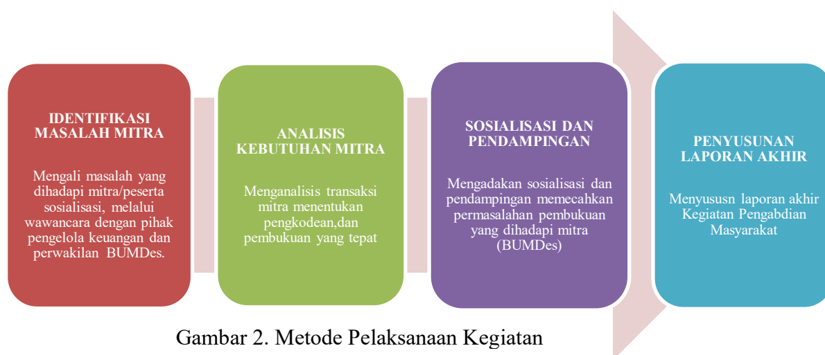
Gambar 2. Metode Pelaksanaan Kegiatan

Adapun solusi yang dapat ditawarkan dari program ini antara lain: