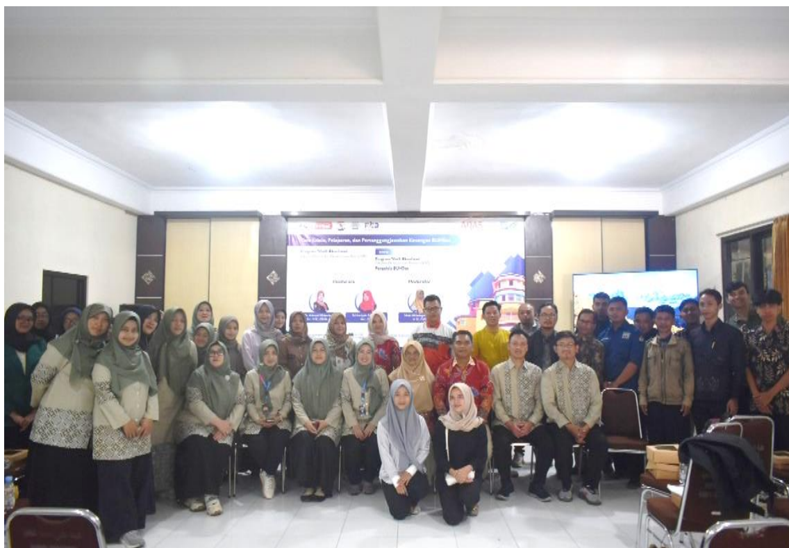
Gambar 11. Team PKM FEB Universitas Sains Al-Qur'an Jawa Tengah di Wonosobo dengan Team FE Universitas Pendidikan Indonesia (UPI) Bandung Jawa Barat bersama peserta pelatihan.