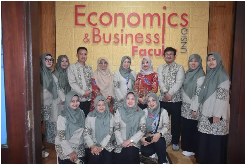
Gambar 10. Dosen FEB UNSIQ bersama Dosen FEB UPI Bandung