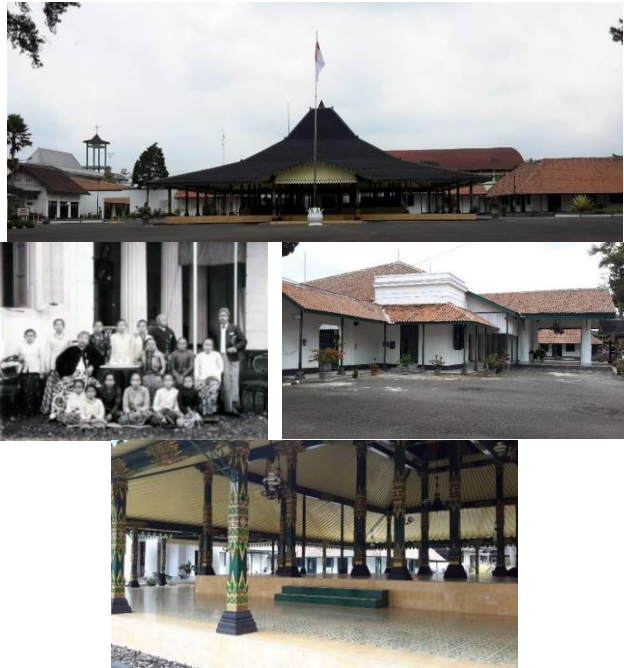
Gambar 12. Komplek Pendopo Kabupaten Wonosobo

masa depan Timor Timur, Pulau cocos, Pulau Christmast, Sabah, Vietnam dan Khmer (sumber: jejak langkah Pak Harto 27 Maret 1973-23 Maret 1978, hal 155 – 156, ditulis Tim Dokumentasi Presiden RI).