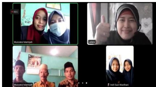
Gambar 1. Koordinasi tim dengan mitra Guru SDI Al-Imarah dan Komite Sekolah.

muka dengan tetap mematuhi protokol kesehatan. sebagaimana ditunjukkan pada Gambar 1.