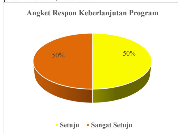
Gambar 6. Persentase angket respon

91,99% berada dalam kategori sangat positif. Angket respon guru sebesar 87,50% berada dalam kategori sangat positif. Perolehan persentase angket sebagaimana ditunjukkan pada Gambar 5 berikut.