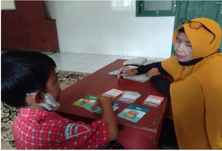
صورة ٤، يشير الطالب الصورة الصحيحة

يتم فهم الطلاب المتخلفين ذهنياً من خلال اللعبة من المدرسة مثل الإشارة أو إقران المفردات بالصورة الصحيحة. باستخدام هذه الوسائل المصورة ، يفهم الطلاب المفردات العربية بسهولة ويسر. تنطق المعلمة المفردات ويشير الطالب بالصورة الصحيحة.