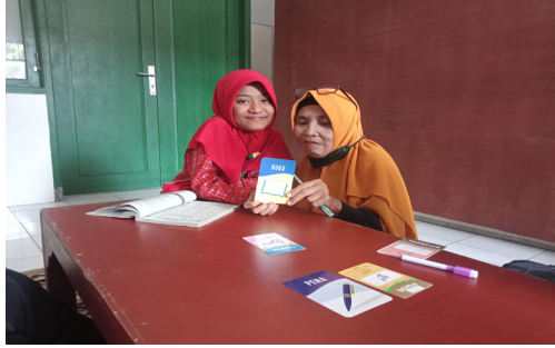
صورة ١. تعرض المدرسة البطاقة المصورة إلى الطلاب معاقين ذهنياً

تعرض المدرسة وسائل التعلم ببطاقات كلمات مصورة للطلاب معاقين ذهنياً من أجل جذب الانتباه وتحفيزهم على التعلم.