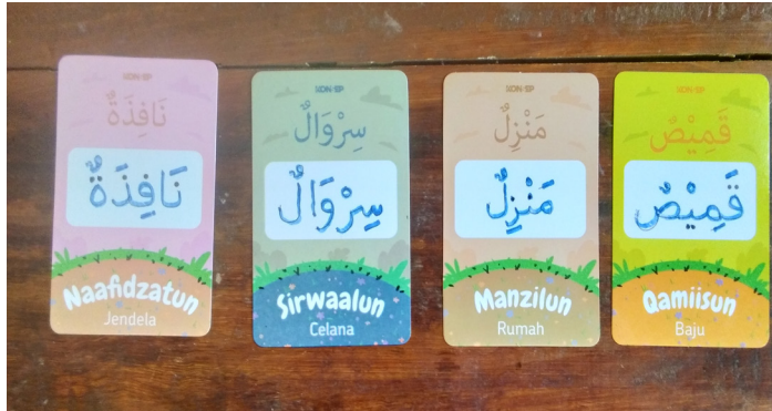
صورة ٣. كتابة الطلاب معاقين ذهنياً بمساعدة البطاقة