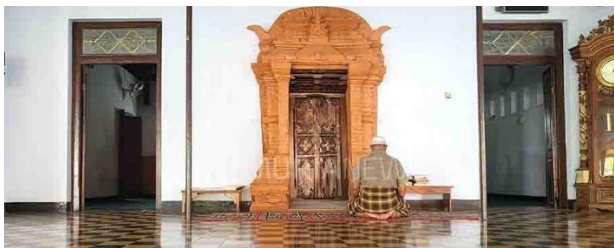
Gambar 2. Pintu padureksan yang diapit 2 pintu