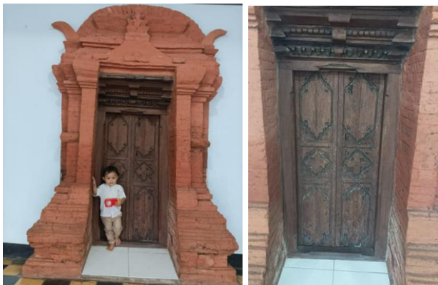
Gambar 3. Pintu kayu yang pendek dan kecil pada gapura padureksan

https://images.murianews.com/data/2025/03/image-20250308112742.jpg