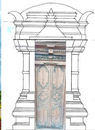
Gambar 7. Candi Bajang Ratu Trowulan (kiri) dan Gapura Pintu Masjid Hadiwarno Kudus (kanan)