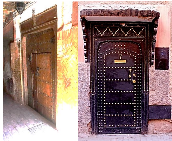
Gambar 8. Pintu pendek pada Rumah Kuno Maroko

Dalam tradisi Islam di luar Indonesia, di pemukiman tua (riad) di Maroko, pintu didesain berukuran pendek dengan tujuan menumbuhkan rasa kerendahan hati dan menunjukkan rasa hormat kepada pemilik rumah atau tempat suci, seperti terlihat pada gambar 09