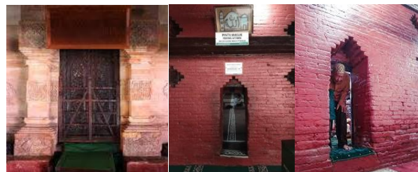
Gambar 5. Pintu utama di tengah dan 4 buah pintu dikanan dan 4 buah pintu di kiri

Letak pintu masuk lainnya adalah 4 pintu di sebelah utara dan 4 pintu di sebelah selatan. Pintu yang terletak di sebelah timur, baik yang di sebelah utara maupun yang di sebelah selatan berukuran tinggi 168 cm, dengan lebar 68 cm. Setiap orang yang akan masuk masjid harus dengan tubuh membungkuk (Hernawan,Wawan,2021). (lihat gambar 5).