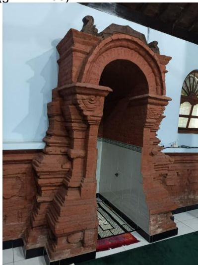
Gambar 4. Mihrab masjid, atapnya berbentuk melengkung

Di dalam masjid terdapat mihrab dengan bentuk seperti gapura padureksan , tetapi bentuk puncaknya lengkung. Bentuk mihrab memperlihatkan bagaimana Wali perancang masjid berhasil memadukan unsur Hindu dan Islam. Bentuk gapura padureksan yang digabung dengan bentuk lengkung yang dikenal di timur tengah (gambar 05).