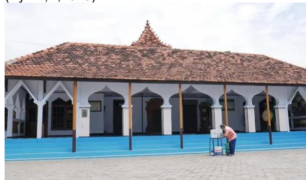
Gambar 1. Masjid Abdul Aziz (wali Hadiwarno) Kudus

Masjid Wali Hadiwarno ( Baitul Aziz ) dibangun kurang lebih pada abad 15 M. Masjid Wali Hadiwarno termasuk peninggalan pada masa Sunan Kudus. Pintu Gapura Padureksan terletak di tengah ruang sholat, terdapat pintu pendek yang terbuat dari kayu jati dan pada bagian atas pintu terdapat lambang naga motif lambang naga yang mempunyai arti trisula naga dalam bahasa sansekerta artinya 863 hijriah atau 1458 M (Syarif,K,2019).