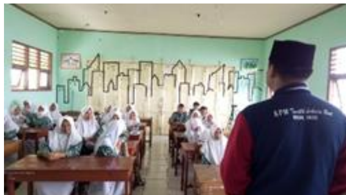
Gambar 2. Sosialisasi stunting kepada peserta didik desa Krinjing

Desa Krinjing sendiri memiliki 6 instansi pendidikan, yang tersebar di empat dusun yaitu SD N 1 Krinjing, SD N2 Krinjing, MI Guppi Gumawang, MTS Binaul Akram, SMP NU 1 Watumalang, MTS Darruttholibin Gumawang. Sasaran sosialisasi ini adalah para siswa yang nantinya akan menjadi generasi penerus bangsa. Penyampaian materi dilakukan oleh peserta kpm dengan menggunakan metode ceramah dan diskusi menggunakan media audio visual. Kami juga melakukan monitoring dengan melakukan sesi tanya jawab tentang seberapa jauh mereka paham akan hidup sehat.