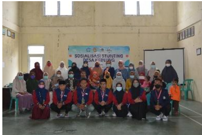
Gambar 2. Sosialisasi stunting kepada kader posyandu desa Krinjing