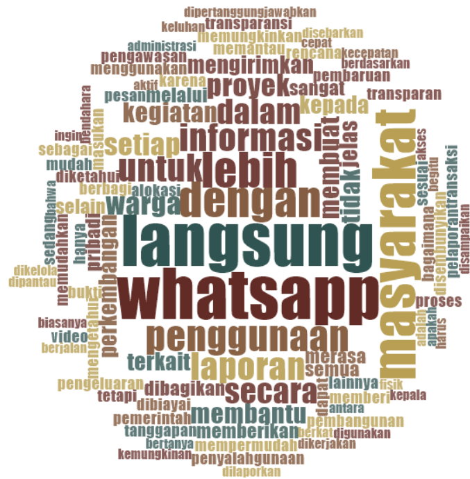
Gambar 2. Word Cloud Berbasis NVivo 12 Plus

Platform WhatsApp yang awalnya berfungsi sebagai aplikasi pesan instan, kemudian berubah menjadi instrumen strategis dalam tata kelola dana desa. Penggunaan WhatsApp memungkinkan komunikasi yang cepat dan mudah antara perangkat desa dan masyarakat, sehingga laporan anggaran, dokumentasi pembangunan, dan perkembangan kegiatan dapat dibagikan secara real-time . Perangkat desa merasakan kemudahan dalam mengirim beragam bukti transaksi, foto proyek, ataupun penjelasan anggaran, sementara masyarakat dapat memantau perkembangan