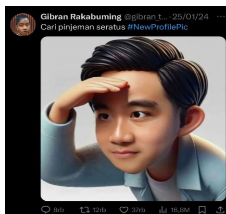
Gambar 3. Foto Profil Gibran di X Yang Menggunakan AI

Contoh Interaksi yang dilakukan oleh Gibran dengan pengikut media sosialnya terlihat pada tanggal 16/02/2024, dimana salah satu pengguna X meminta Gibran untuk menggunakan foto dengan wajah yang tidak ‘ngeselin’ untuk foto yang akan dipajang di kantor dan sekolah-sekolah ketika ia sudah menjadi wakil presiden Indonesia kelak dan Gibran membalas X tersebut dengan mencantumkan foto wajahnya yang berbentuk meme dengan caption “Ini aja ya” yang pada akhirnya foto tersebut ia jadikan sebagai foto profile utama akun X nya. Dengan respon yang demikian, banyak dari warga pengguna twitter yang terhibur dengan gurauan dan humor yang Gibran punya. Gibran juga sering memposting cuitan dengan emoji-emoji yang sering digunakan oleh generasi muda dan sulit dimengerti oleh para generasi tua, dimana emoji-emoji ini merepresentasikan makna-makna humor tertentu yang hanya diketahui oleh generasi muda dan pengguna X lainnya.