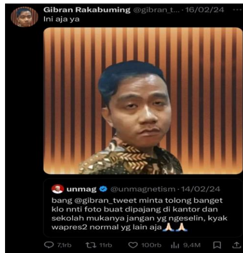
Gambar 2. Respon Gibran Terhadap Pengguna X lainnya

Hal ni sempat menjadi masalah karena Gibran mengungkapkan bahwa ia menerima banyak complain dari masyarakat. Pola interaksi online yang dilakukan Gibran sangat menonjolkan dirinya yang berjiwa muda dan masih membaur bersama generasi muda dan siap untuk membantu secara langsung permasalahan-permasalahan yang dikeluhkan masyarakat melalui cuitan-cuitannya yang mengundang berbagai macam respon dari pengguna X lainnya.