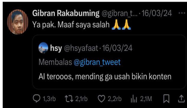
Gambar 4. Respon Gibran Terhadap Pengguna Lainnya

Namun, tidak jarang juga cuitan Gibran di twitter membawa malapetaka bagi dirinya. Seperti pada cuitannya di twitter di tanggal 25/01/2024 dimana ia mengganti foto profile akun twitternya dengan foto hasil buatan AI (Artificial Intelligence) dengan gaya gimmick nya pada saat debat Cawapres kedua yang membuatnya viral di kalangan masyarakat dan dimedia sosial. Cuitannya ini menerima banyak respond negative, terutama dari kalangan senimar Indonesia yang sangat menolak adanya keterlibatan AI dalam pembuatan karya seni, dan menurut mereka penggunaan AI yang digunakan Gibran sebagai calon wakil presiden merupakan tindakan yang kurang etis dan seperti tidak menghargai dan mengapresiasi para ilustrator anak bangsa.